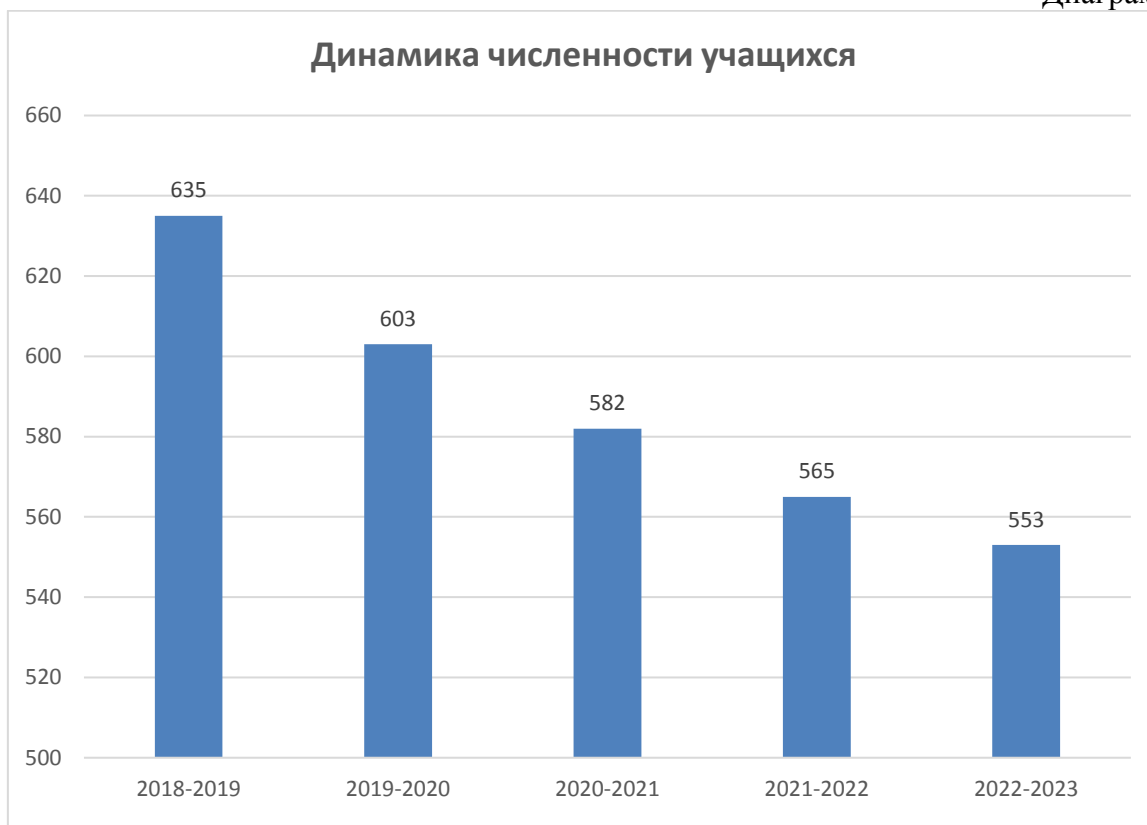
Диаграмма № 2